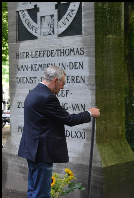
Gedenksteen Thomas a Kempis op Bergklooster. Het licht wordt ontstoken.