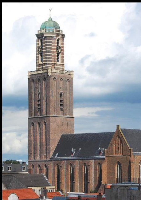
Onze Lieve Vrouwe Basiliek