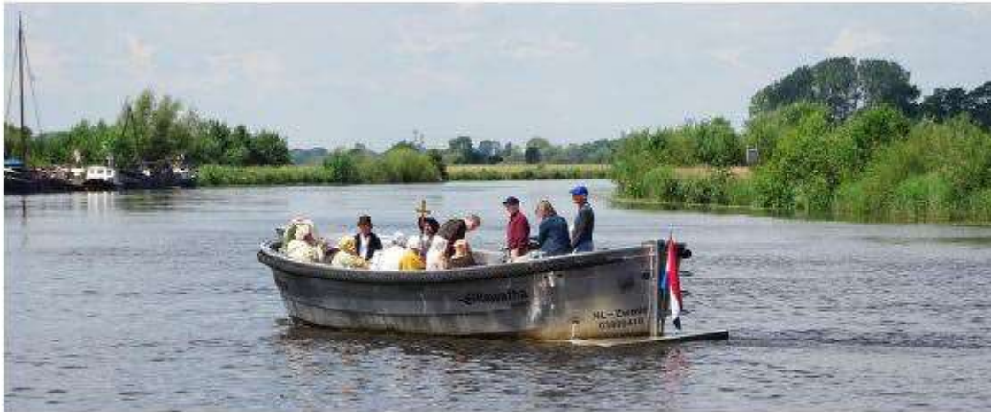
Vlucht vanaf het 'Agnietenklooster' via het Haesterveer over de Vecht naar Hasselt

aan het Zwarte Water, waar het gezelschap ontvangen werd door het College van B&W en enkele zusters van het Mariaklooster, waar destijds de monniken onderdak kregen.